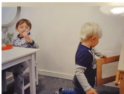
Leg i køkkenhjørnet