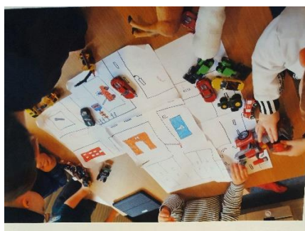
Legezoner ved bord