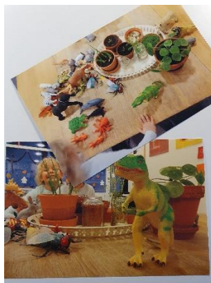
Små legezoner om morgenen

Evalueringen har givet et mere fælles ejerskab af vores Læreplan, da både pædagoger og medhjælpere deltog i arbejdsgrupper på tværs af stuer og afdelinger. Det har givet alle medarbejdere et større kendskab til den pædagogiske praksis i hele huset, og den røde tråd i det pædagogiske arbejde er blevet mere tydelig på tværs af afdelingerne. Dette gav rum for inspiration og sparring i en tid, hvor vi ikke må samles på tværs.